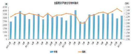
※「不動産流通機構」データより

前年対比で成約件数が増加しています。 成約価格についてはばらつきがあります。 物件の不足は成約数からも読み取れます。